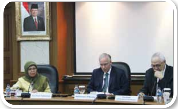
▲ Keterangan foto :

UN-REDD Programme Indonesia untuk kedua kalinya mengadakan Rapat Dewan Eksekutif untuk membahas progres program dan peran para pemangku kepentingan terkait (Jakarta, 12 Mei 2011).