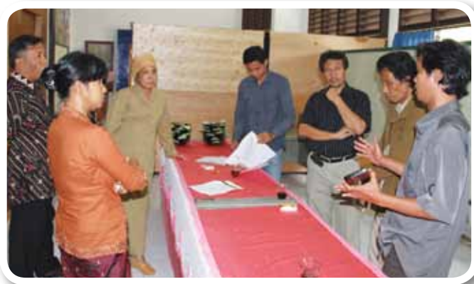
◀ Keterangan foto :

Di tingkat sub-nasional, UN-REDD Programme Indonesia memfasilitasi Kelompok Kerja (Pokja) REDD+ Sulawesi Tengah mengembangkan kriteria dan indikator untuk pemilihan kota/kabupaten. Ini dilakukan oleh Pokja dengan mengacu pada kriteria dan indikator yang dikembangkan di tingkat pusat, namun mengakomodasi kebutuhan Provinsi Sulawesi Tengah. Aspek-aspek ekologi, ekonomi, dan sosial merupakan perhatian utama dalam pembahasan Pokja. Dengan keanggotaan Pokja yang terdiri dari berbagai pemangku kepentingan, penetapan kriteria dan indikator ini mencerminkan pandangan yang komprehensif, menjadikannya rujukan untuk melihat kelayakan kota/kabupaten di Sulawesi Tengah sebagai lokasi pelaksanaan REDD+.