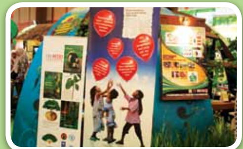
▲ Keterangan foto :

Untuk menambah wawasan para pengunjung, UN-REDD Programme Indonesia juga berpartisipasi mengadakan diskusi santai dan kuis berhadiah tentang perubahan iklim bersama mitra-mitra lain di Rumah Iklim Pustanling. Para pengunjung tampak menunjukkan rasa ingin tahu mereka tentang program-program yang dipublikasikan. Melalui acara semacam ini, diharapkan rakyat Indonesia semakin sadar akan pentingnya peran hutan dalam kehidupan manusia, dan tergerak untuk berpartisipasi dalam upaya-upaya menjaga lingkungan.