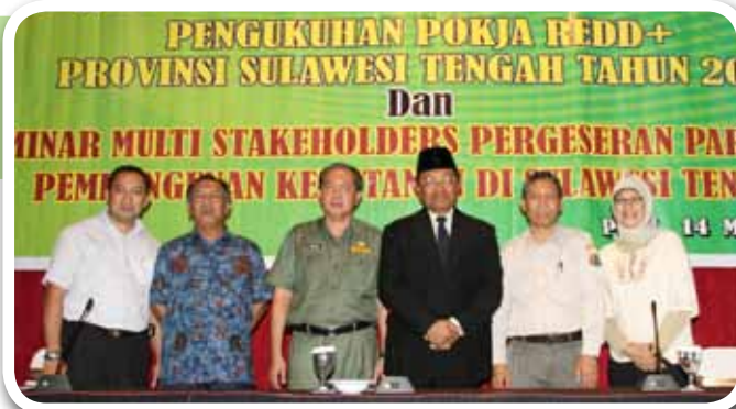
▲ Keterangan foto :

Sebagai bentuk dukungan dan pengakuan dari Pemerintah Provinsi Sulawesi Tengah atas Pokja REDD+, selain penetapan Pokja dengan