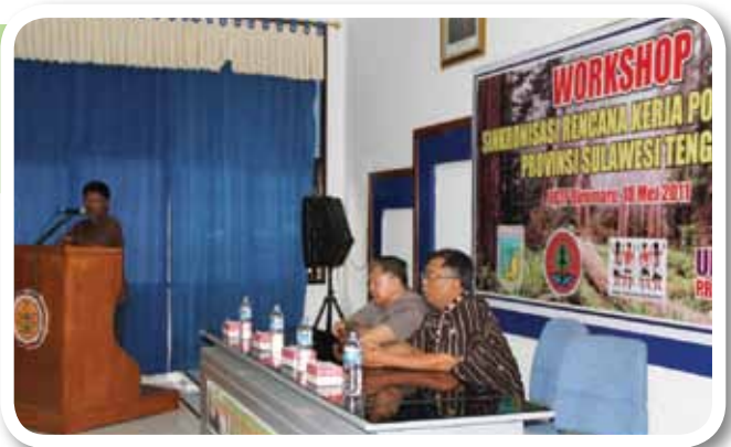
▲ Keterangan foto :

Keberhasilan DA dapat menjadi pembelajaran dan rujukan penerapan REDD+ secara lebih luas dan lebih baik di masa depan. Oleh karenanya, pemilihan DA bukan hal yang mudah. Diperlukan pertimbangan yang matang agar potensi kegagalan dapat diminimalkan, sementara potensi keberhasilan dapat ditingkatkan. Di tingkat nasional, UN-REDD Programme Indonesia mendukung upaya-upaya Kementerian Kehutanan Republik Indonesia (RI) dalam mengembangkan kriteria dan indikator yang akan digunakan dalam pemilihan DA. Hasil-hasil dari pembahasan kriteria dan indikator