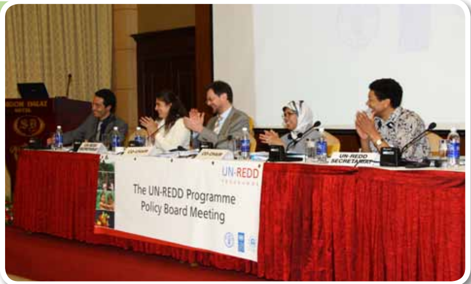
▲ Keterangan foto :