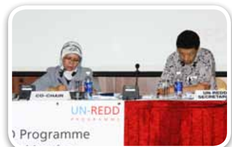
▲ Keterangan foto :

Lebih lanjut, presentasi pelaksanaan 7 (tujuh) program UN-REDD yang sudah berjalan (Bolivia, Indonesia, Panama, Republik Demokratik Kongo, Tanzania, Vietnam, dan Zambia) memberikan gambaran capaian, tantangan, dan pembelajaran. Presentasi tentang progres di Indonesia disampaikan oleh Direktur Inventarisasi dan Pemantauan Sumber Daya Hutan Kementerian Kehutanan RI selaku National Programme Director UN-REDD Programme Indonesia. UN-REDD Programme Indonesia menyampaikan bahwa capaiannya antara lain tersusunnya Rekomendasi Kebijakan untuk Persetujuan Atas Dasar Informasi Awal Tanpa Paksaan ( Free, Prior and Informed Consent atau FPIC)