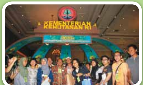
▲ Keterangan foto :