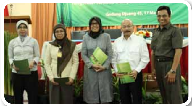
▼ Keterangan foto :

rekomendasi kebijakan itu, diharapkan para pemangku keputusan mendukung pelaksanaan FPIC yang sesuai konteks masyarakat yang terkena dampak langsung implementasi REDD+ di Indonesia.