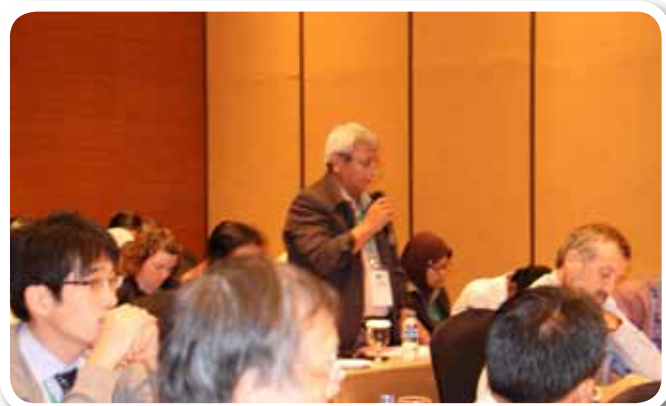
◀ Keterangan foto :