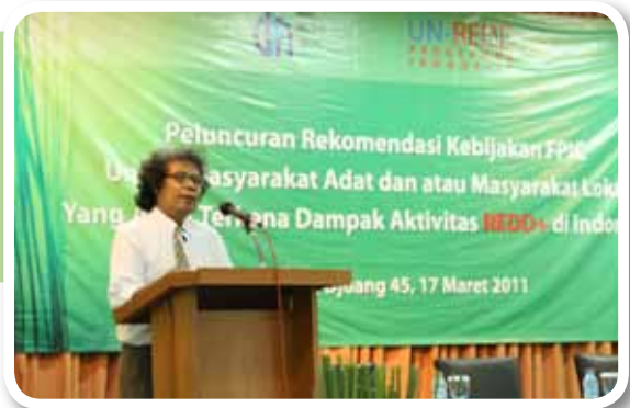
▲ Keterangan foto :

UN-REDD Programme Indonesia selama ini aktif mendukung pemerintah Indonesia dalam upaya-upaya yang menuju kesuksesan implementasi REDD+ di Indonesia. Salah satu upaya yang menjamin implementasi REDD+ yang adil, setara, dan transparan adalah prinsip Persetujuan atas Dasar Informasi Awal Tanpa Paksaan ( Free, Prior and Informed Consent atau FPIC). Prinsip ini memungkinkan masyarakat untuk menyatakan apakah mereka setuju atau tidak setuju terhadap sebuah kebijakan atau kegiatan yang berpotensi mempengaruhi kehidupan masyarakat itu.