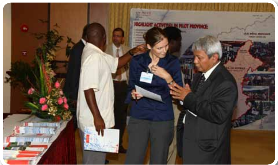
▲ Keterangan foto :